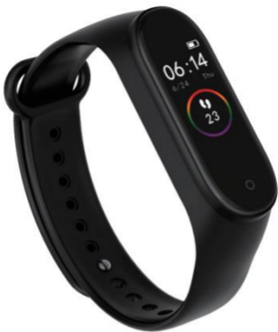
BRAZALETE DEPORTIVO M4